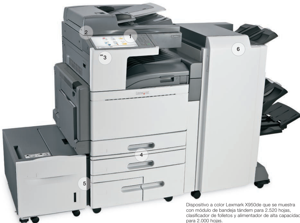
Dispositivo a color Lexmark X950de que se muestra con módulo de bandeja tándem para 2.520 hojas, clasificador de folletos y alimentador de alta capacidad para 2.000 hojas.